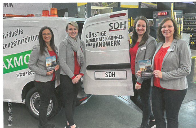
Für Fragen und detaillierte Erklärungen rund um die gewerbliche Mobilität steht das Team der SDH auf der Messe zur Verfügung.

Handwerkerinnen und Handwerker haben auf der Messe die Möglichkeit, sich bei SDH über gewerbliche Mobilität zu informieren. Im Mittelpunkt stehen dabei vor allem Vergünstigungen beim Fahrzeugkauf und -leasing. Dank Rahmenverträgen mit 24 renommierten Automobilherstellern bietet die SDH Nachlässe auf ein breites Spektrum von Fahrzeugen – von Pkw über SUVs und Pick-ups bis hin zu Transportern, sowohl mit Verbrennungsmotoren als auch als Hybrid- oder Elektromodelle. Fachbesucher erfahren vor Ort, wie sie von diesen Sonderkonditionen profitieren und welche aktuellen Angebote in Kooperation mit führenden Automobilherstellern zur Verfügung stehen.