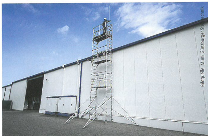
Mit dem Ein-Personen-Gerüst mit drei statt zwei Ebenen sollen Anwendende Arbeitshöhen von bis zu 9,55 Metern erreichen.

Auf der BAU erfährt das Publikum, wie es mit dem neuen FlexxTower SGX der Munk Günzburger Steigtechnik ganz neue Höhen erreicht: Das 1,80 Meter lange Ein-Personen-Gerüst verfügt über drei statt zwei Ebenen und soll so Arbeitshöhen von bis zu 9,55 Metern ermöglichen. Und das besonders ergonomisch, denn das Rollgerüst ist auf allen Ebenen mit der Ergo-Plattform ausgestattet: Diese ist um bis zu 40 Prozent leichter als übliche Rollgerüstplattformen und entlastet so den Anwendenden bei Aufbau und Transport. Das Gerüst verfügt über Sicherheitsgeländer und entspricht daher laut Anbieter der DIN EN 1004. Es lässt sich gänzlich werkzeuglos von nur einer Person montieren.