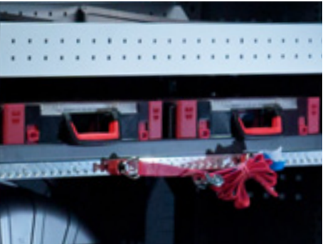
Zwei robuste Werkzeugkoffer