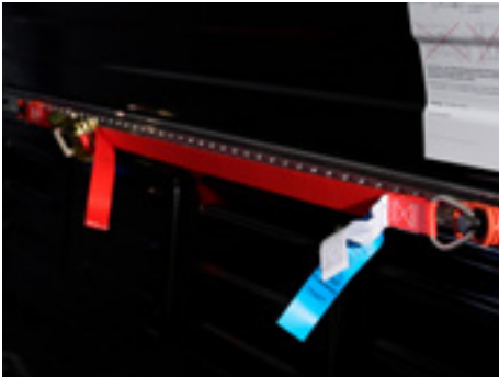
Sicherungsgurte und -schienen zur zuverlässigen Ladungssicherung