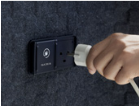
Abbildungen zeigen kostenpflichtige Sonderausstattungen.