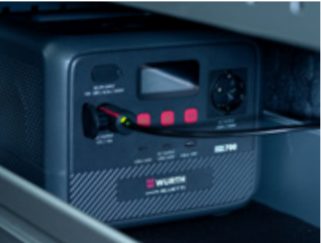
Mobile Powerstation: Würth Mopo 700 mit 700 W Ausgangsleistung (Nennenergie 504 Wh)