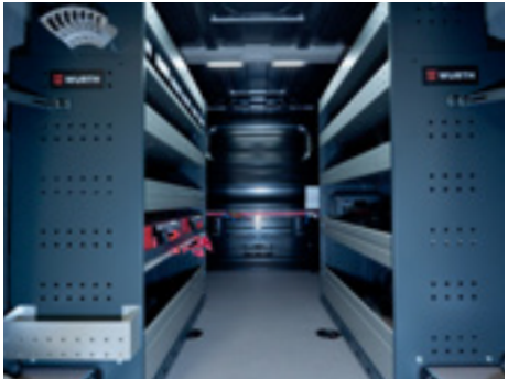
Zwei stabile Ablageblöcke links und rechts mit Ablagefächern und Ablageschalen für Werkzeuge und Kleinteile

Dank der Ladegeschwindigkeit lädt der Kia PV5 Cargo von 10 % auf 80 % in nur 30 Minuten 2 – ideal für flexible Einsätze unterwegs. Die niedrige Ladekante und die großzügige Begehrbarkeit machen das Be- und Entladen zum Kinderspiel. So ist der Kia PV5 Cargo perfekt auf die Anforderungen von Elektrikern, Handwerkern und allen mobilen Gewerken abgestimmt.