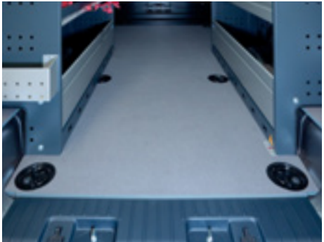
Bodenplatte mit integrierten Zurrösen